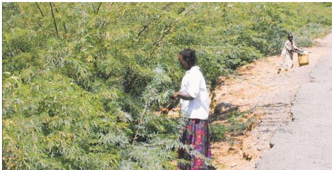
Prosopis Juliflora ou « Mathenge »

La situation au Kenya fournit un nouvel exemple des indispensables précaution à adopter lorsque l'on tente de remédier à un problème en introduisant des organismes exogènes au milieu naturel que l'on souhaite préserver. Pour lutter contre la sécheresse, les autorités kényanes ont recouru à la Prosopis juliflora , une plante résistante, aux racines profondes originaire d'Amérique centrale. Cette espèce s'est rapidement répandue, de manière invasive. Les éleveurs nomades de la région du Turkana qui l'utilisaient comme plante fourragère ont vu leur troupeau de caprins perdre leurs dents en raison d'une propriété de la plante. Cette dernière prolifère, même pendant la saison sèche et empêche le développement de toute autre végétation. Le pouvoir de nuisance de la sécheresse qui