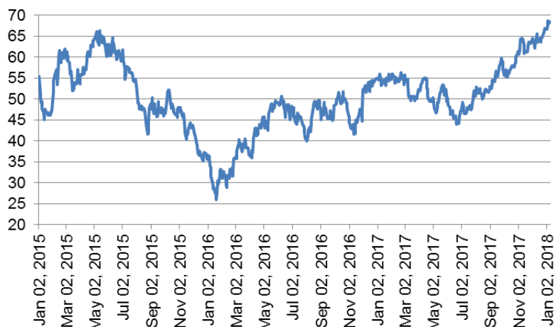
Figure 1 : Prix du pétrole brut Brent (en $ par baril)